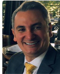
Alexandre Sion Sion Advogados