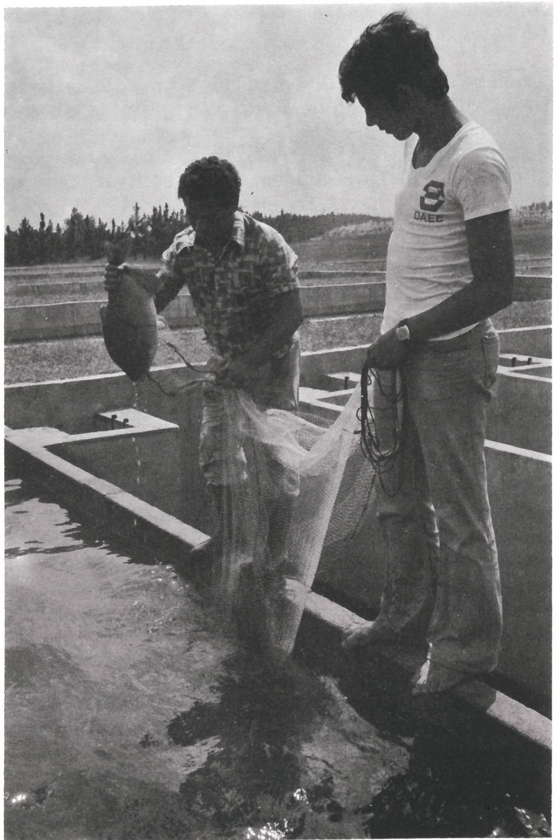
Posto de piscicultura na Represa Ponte Nova.