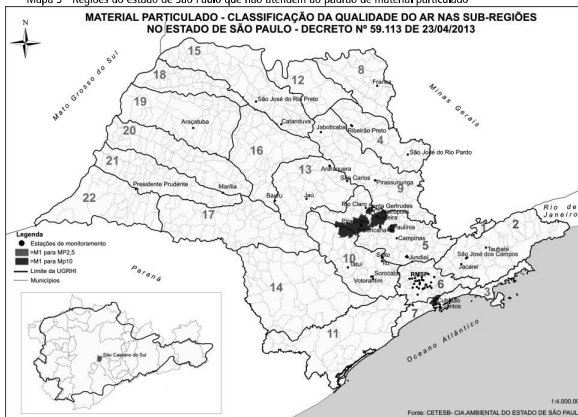
Mapa 3 - Regiões do estado de São Paulo que não atendem ao padrão de material particulado

O Mapa apresenta as regiões do estado de São Paulo comprometidas pelo poluente material particulado. Em parte desses municípios a emissão de origem veicular tem participação importante. Nas demais regiões, as fontes fixas são prioritárias, ainda que em graus variados também haja impacto das fontes móveis.