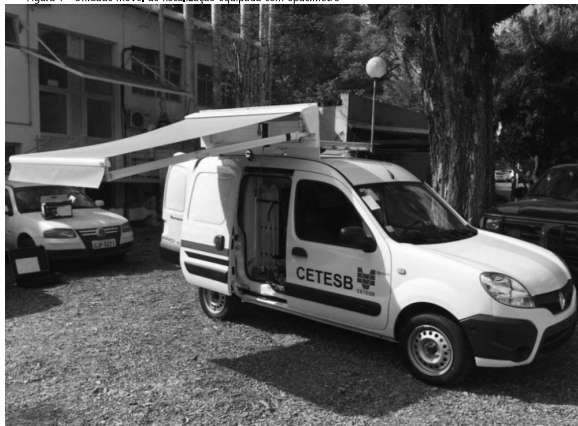
Figura 1 - Unidade móvel de fiscalização equipada com opacímetro

A utilização de opacímetro para a fiscalização de veículos a diesel está prevista pelo Decreto Estadual 54.487/2009. Em 2016 a CETESB adquiriu duas unidades móveis que começaram a ser utilizadas em ações relativas à fiscalização. As unidades estão equipadas de forma que permitem a realização do teste de opacidade de acordo com a legislação vigente. A Figura 1 mostra uma unidade móvel de fiscalização com opacímetro recém-adquiridas.