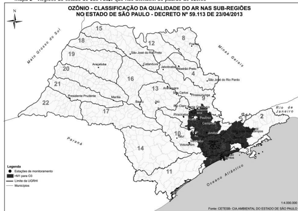
Mapa 2 - Regiões do estado de São Paulo que não atendem ao padrão de ozônio

As áreas prioritárias para o controle da poluição emitida por veículos foram selecionadas a partir da classificação da qualidade do ar aprovada pela Deliberação CONSEMA 12/2013, válida para o período de 2014 a 2016. O Mapa apresenta as regiões do estado de São Paulo onde o padrão de qualidade do ar para o ozônio não foi atendido, classificadas como "Maior que M1" de acordo com o Decreto Estadual 59.113/2013. Essa região é basicamente a Macrometrópole Paulista e é prioritária para o controle dos precursores de ozônio, os compostos orgânicos voláteis e óxidos de nitrogênio.