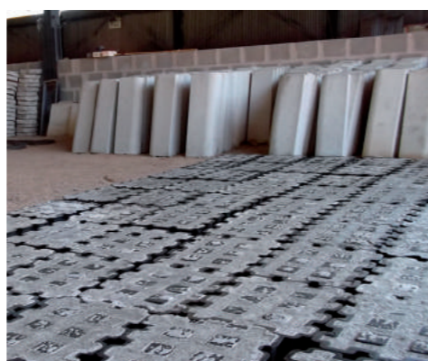
Artefatos fabricados com agregado reciclado