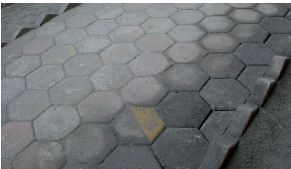
Aproveitamento de bloquetes de demolição da edificação anterior como pavimentação do novo empreendimento